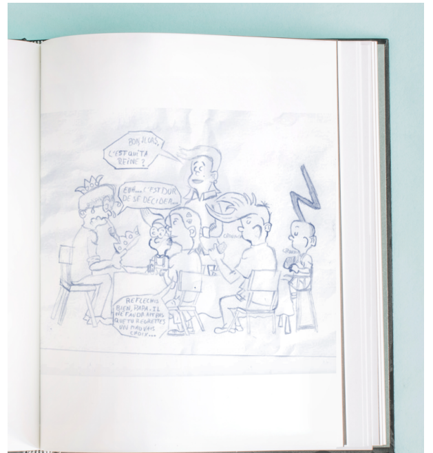
Illustration d'Augustin Coste | Quatrième